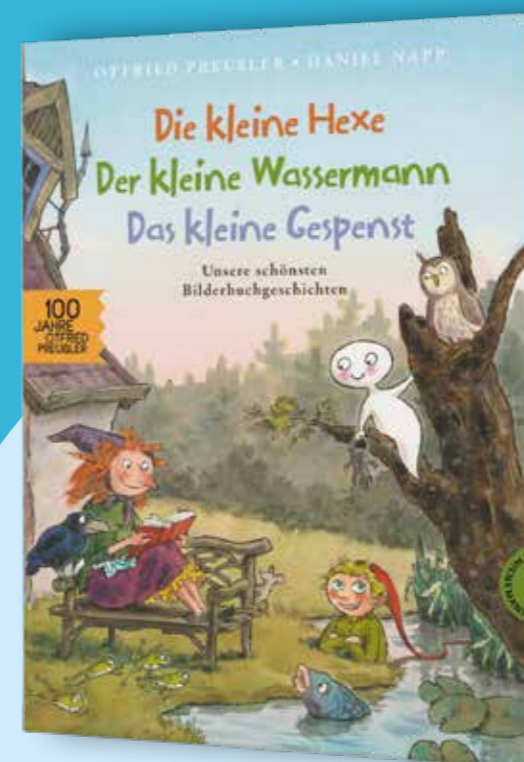
Die kleine Hexe, der kleine Wassermann, das kleine Gespenst ISBN 978-3-522-46052-1 · 20,00 €

Drei erfolgreiche Klassiker- Bilderbücher in einem Band