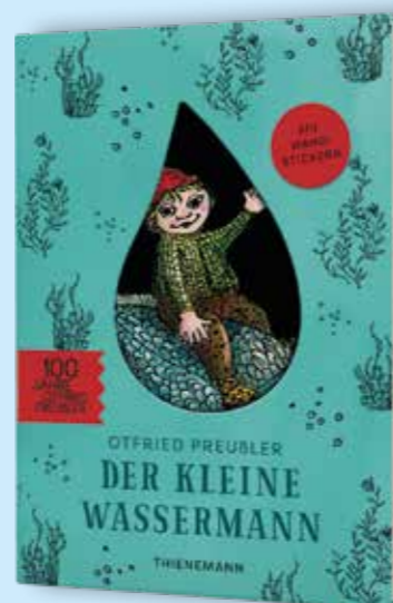
Der kleine Wassermann ISBN 978-3-522-18643-8 · 18,00 €