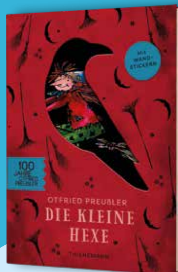
Die kleine Hexe ISBN 978-3-522-18642-1 · 18,00 €