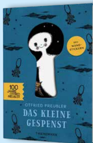
Das kleine Gespenst ISBN 978-3-522-18644-5 · 18,00 €

Limitierte Jubiläumsausgaben mit hochwertigen Wandstickern und Coverstanzung